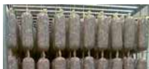
Salame dritto diam. 65