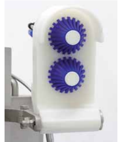
Arricciatore per budella naturali