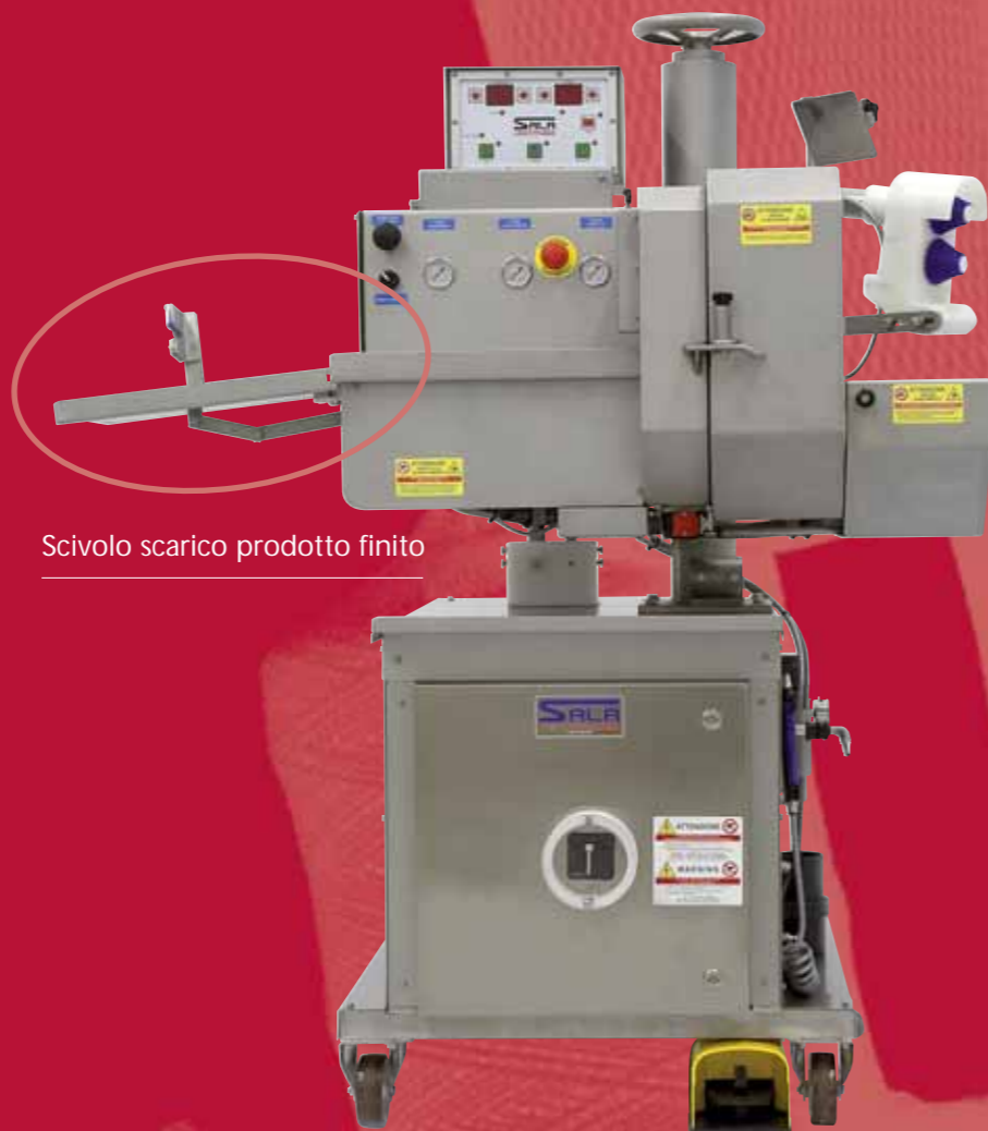
Scivolo scarico prodotto finito