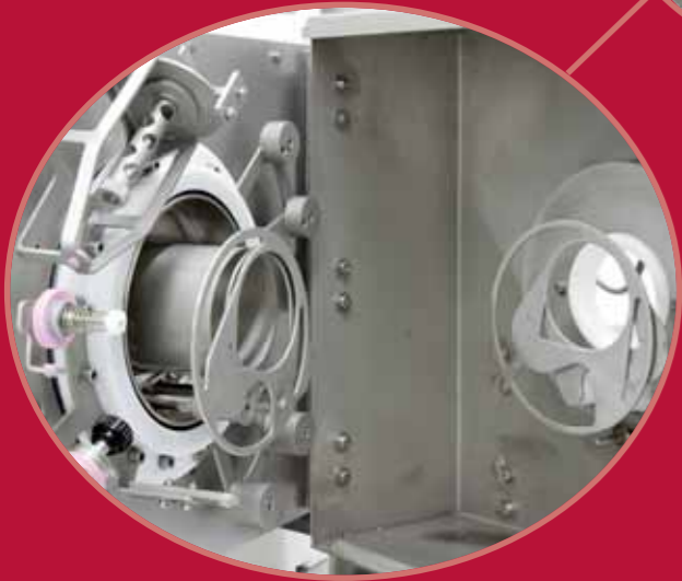
Gruppo di legatura