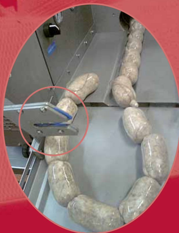
Coltello per taglio manuale