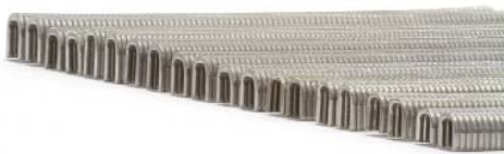
Clips a stick (serie 700) Art. 735/740/744