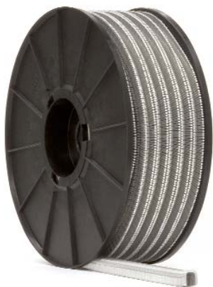
Clips su bobina (serie 700) Art. 735B/740B/744B